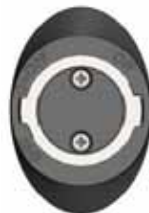
Figure 3 - Réceptacle de base